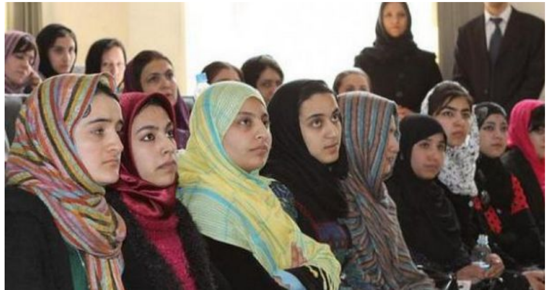
Cours universitaire aujourd'hui