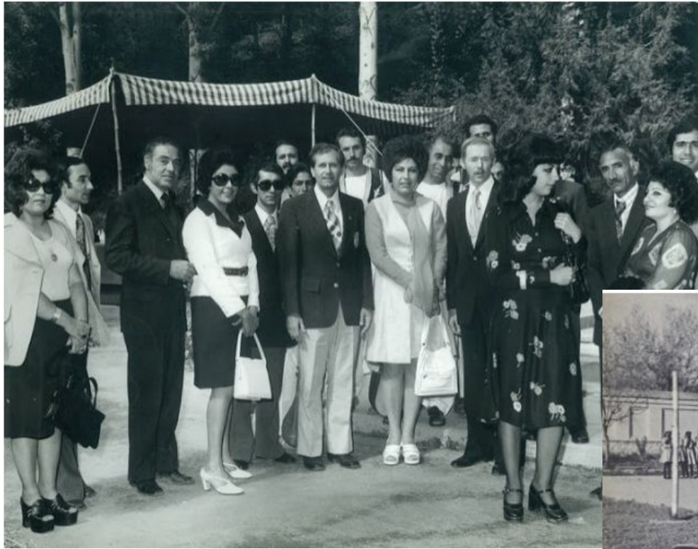
← Réception officielle dans les années 70