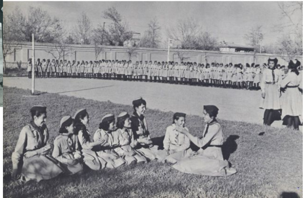
Scout filles dans les années 70 →