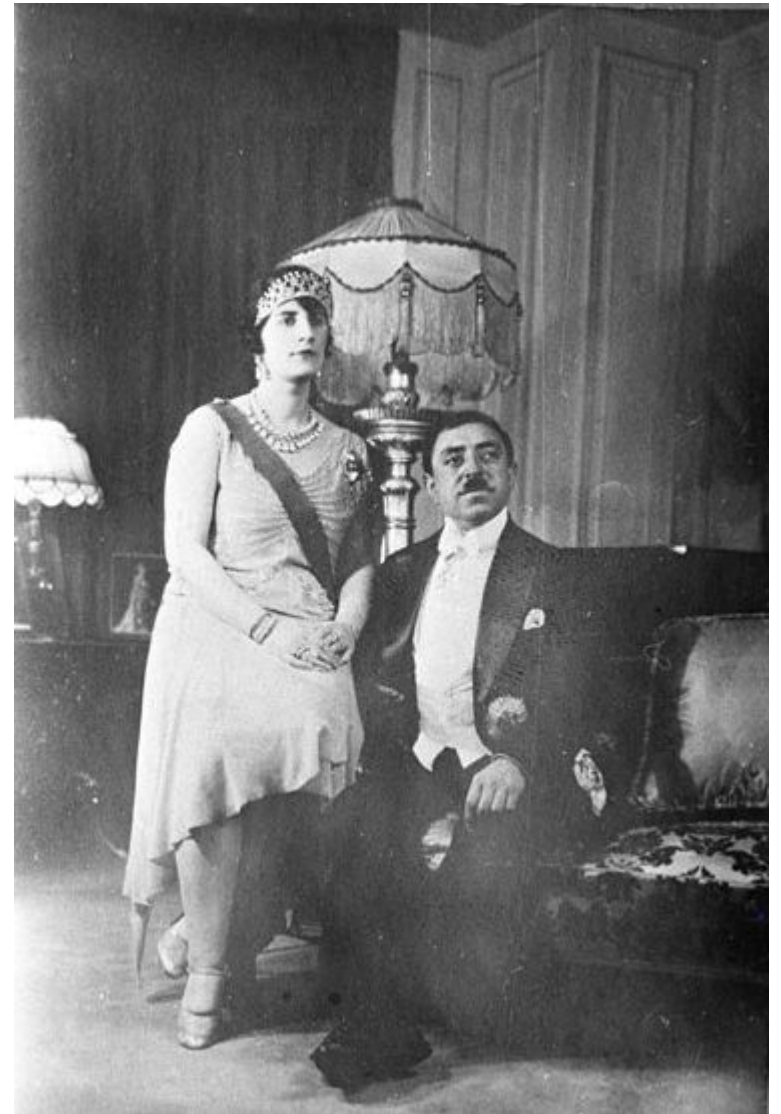
Roi Amanullah et reine Soraya