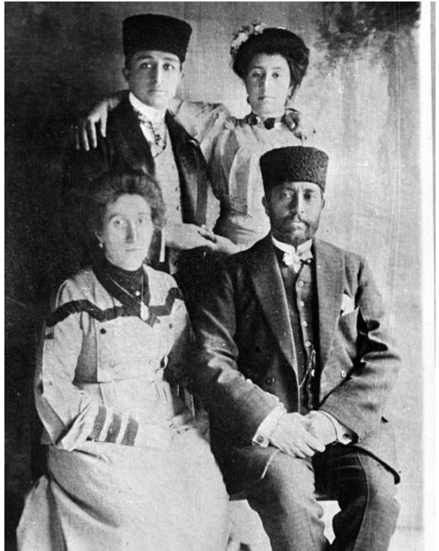
Famille Tarzi et Prince Enayatullah