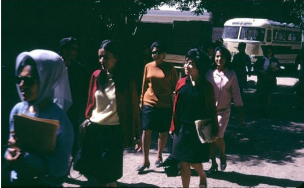
Kaboul, années 70-80