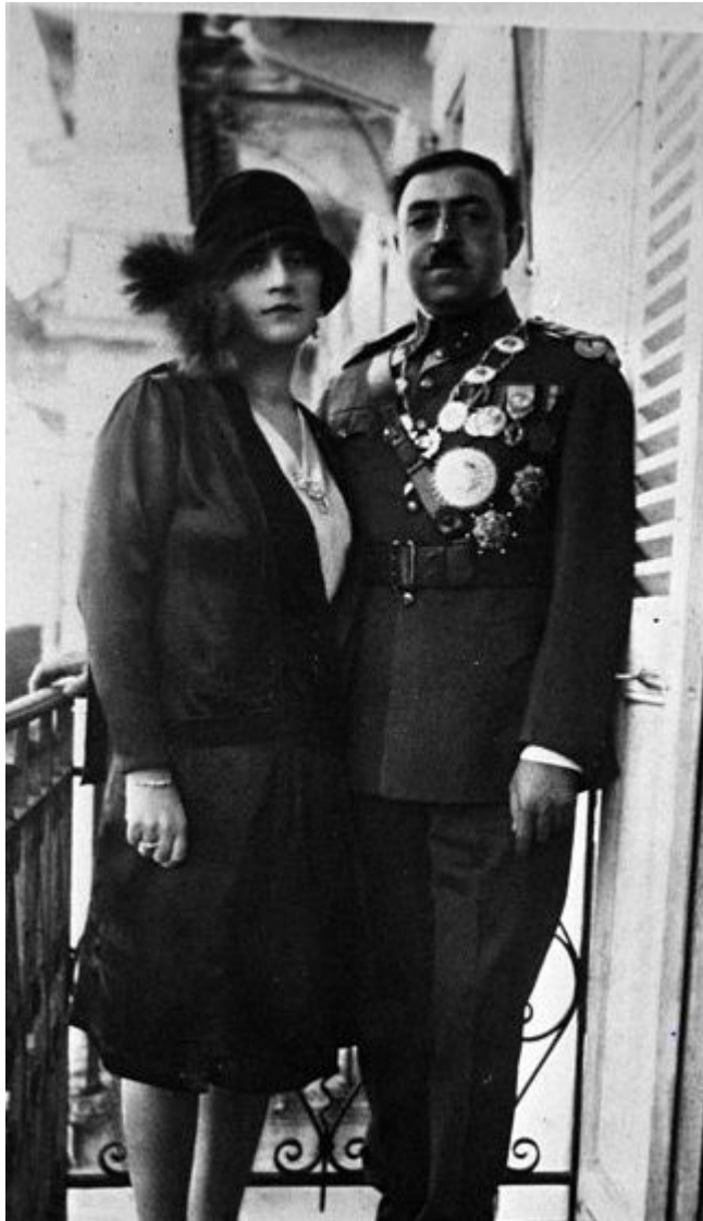
Roi Amanullah et reine Soraya