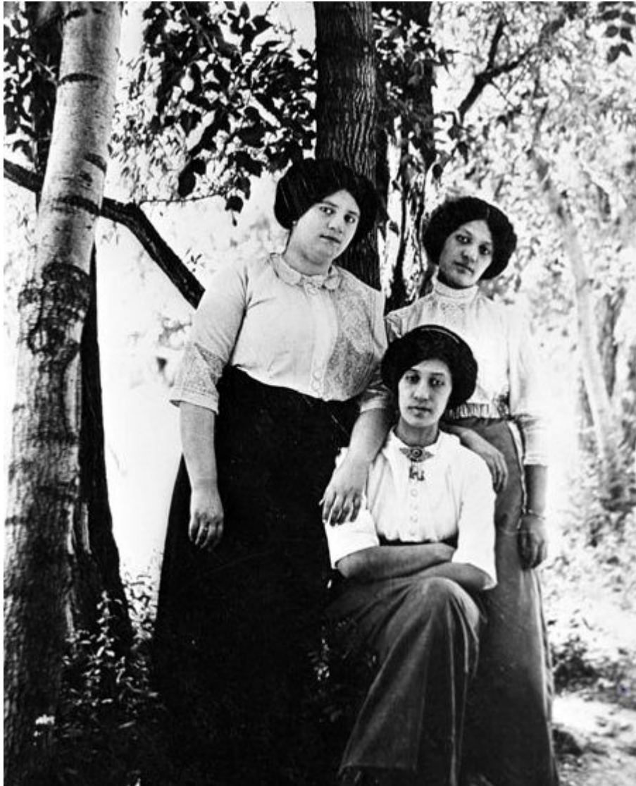
Membres de la famille royale