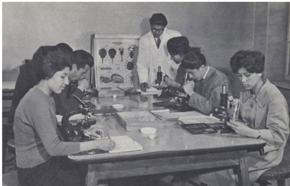
Images de l'université de Kaboul dans les années 60-70s